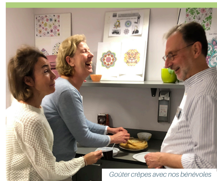
Goûter crêpes avec nos bénévoles